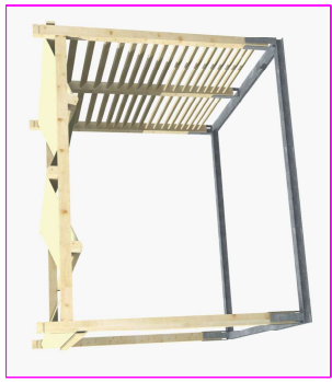
GAZEBO IN LEGNO m.3.50*3.00